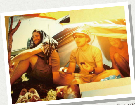
在学中に知り合った留学生との交流がきっかけでニュージーランドへ。写真は友人とのヒッチハイク旅行のようす。

特に寮生活、サークル活動、留学生との交流、語学留学の経験は、順応性や多様性尊重の面で、いまの自分の大きな影響を与えてくれたと思います。運命的にも、アローでの初仕事は母校の大学案内パンフ制作でした。取材するたびに、学生時代には意識することもなかった大学の歴史や環境に自分も育てられていたことを実感しました。