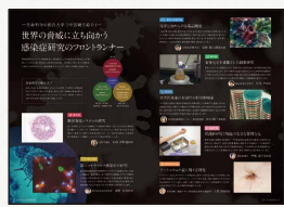
「感染制御」をテーマに7学部の研究を紹介

北里大学には総合案内と学部パンフレットがあるので、各々の役割を明確にして5つの「巻頭企画」を設けました。中でも「全学部長からのメッセージ」や2通りの切り口で紹介した「研究紹介」、北里柴三郎先生と大学の歴史をエピソードと合わせて紹介した「沿革・建学の精神」は、これまでの総合案内にはなく、アローならではの提案ができたと感じています。